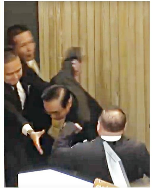
▲ สิ้นลม... พล.อ.ประยุทธ์ จันทร์โอชา นายกรัฐมนตรี พยายามดึงแขน พล.อ.ประวิตร วงษ์สุวรรณ รองนายกรัฐมนตรี ที่เสียหลักล้มกันกระแทกพื้น หลังเสร็จจัดการลงมติผ่านร่าง พ.ร.บ.งบประมาณฯ พ.ศ. 2563

อภิรัชต์ เตรีมเป็นนายกรัฐมนตรีต่อจาก พล.อ.ประยุทธ์นั้น พล.อ.ประวิตร ตอบว่า “ไม่รู้สิ แต่ถ้าเป็นได้ก็ดี” ก่อนหัวเราะและเดินเข้าห้องประชุมทันที